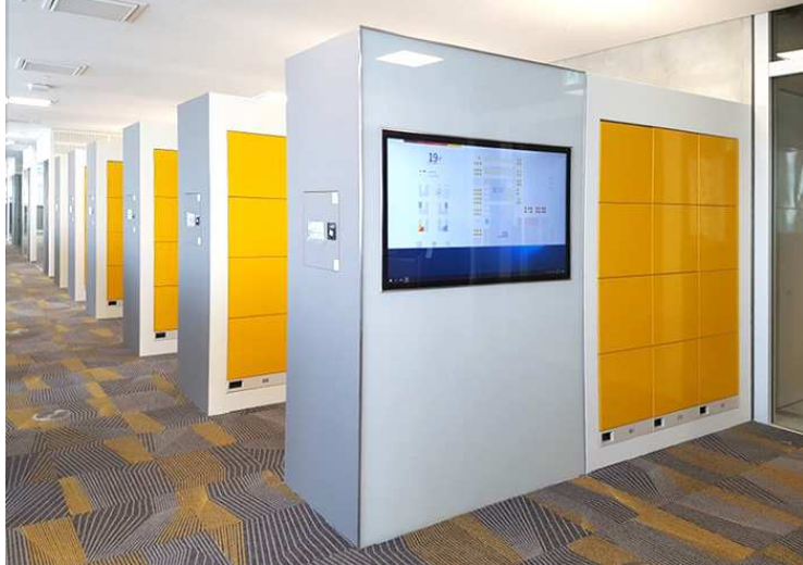
< S회계법인 실제 도입 사진 >